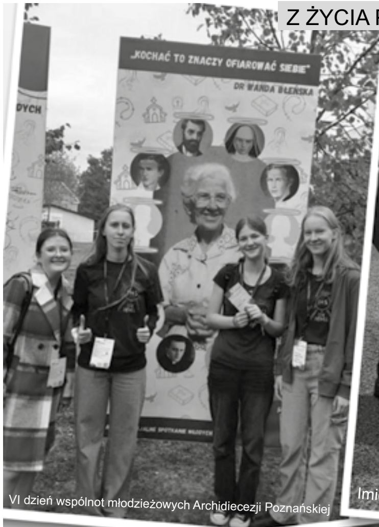
VI dzień wspólnot młodzieżowych Archidiecezji Poznańskiej